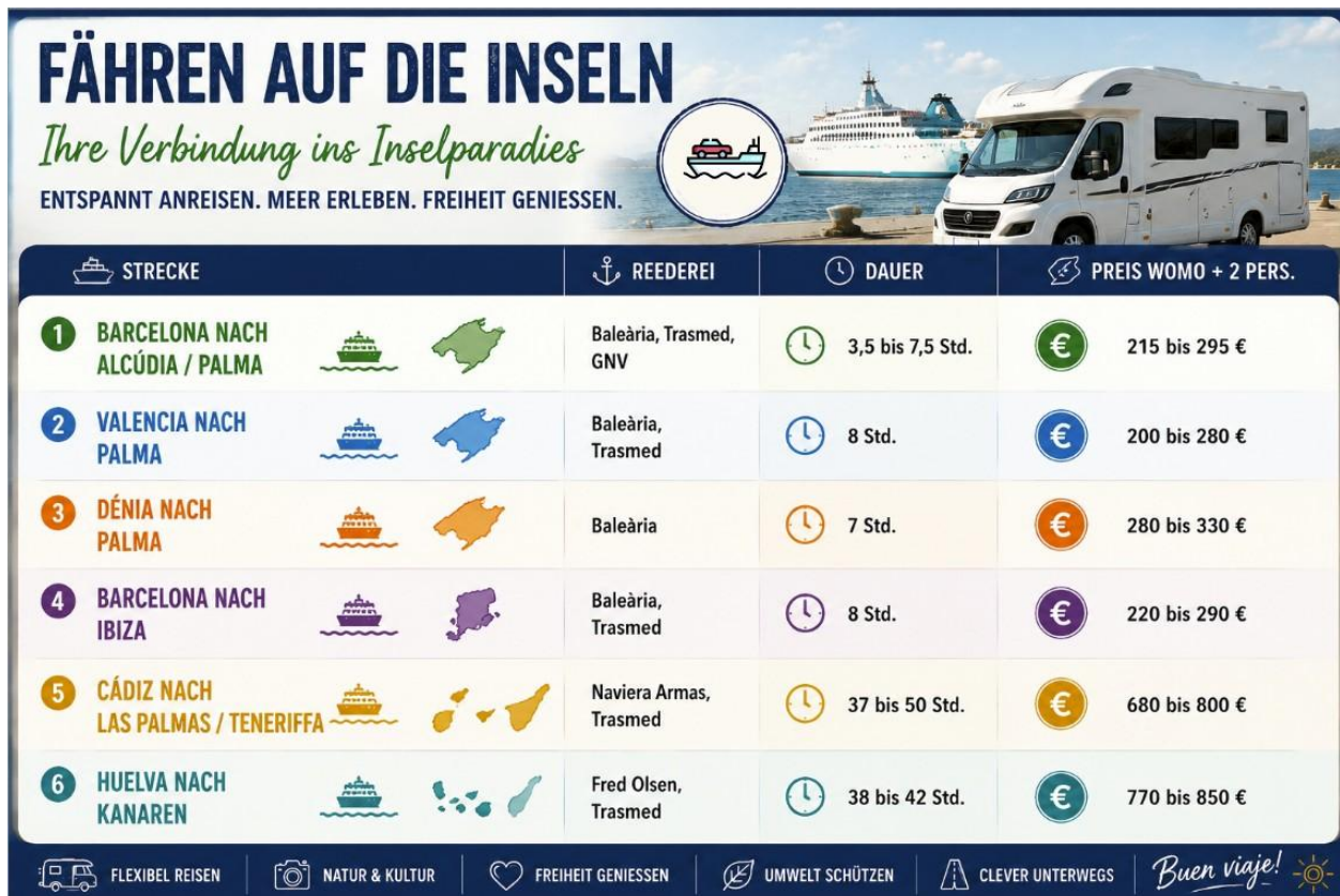
Graphik 7: „Preise für Fähren“

Mit den richtigen Apps ist auch der schwierigste Teil einer Spanien-Reise planbar: die Inseln. Wer mit dem Wohnmobil auf die Balearen oder Kanaren übersetzen will, sollte früh buchen. Wohnmobil-Plätze sind in der Hochsaison oft schon im Frühjahr ausverkauft, und Fährgesellschaften nutzen wie Airlines dynamische Preise.