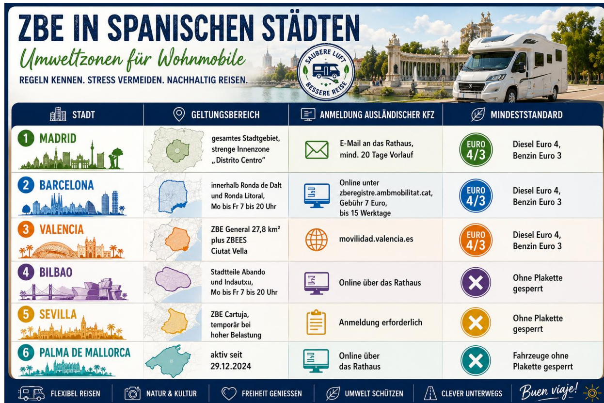
Graphik 2: Übersicht „Umweltzonen in Spanischen Städten“

Wer in Städte will, stößt auf das schwierigste Thema dieser Saison: die Umweltzonen. Die Zonas de Bajas Emisiones, kurz ZBE, sind kein Pilotprojekt mehr, sondern Realität. Über 150 Gemeinden in Spanien müssen 2026 eine ZBE betreiben, die Strafe für Einfahrt ohne Berechtigung beträgt bis zu 200 Euro, halbiert auf 100 Euro bei Zahlung innerhalb von 20 Tagen.