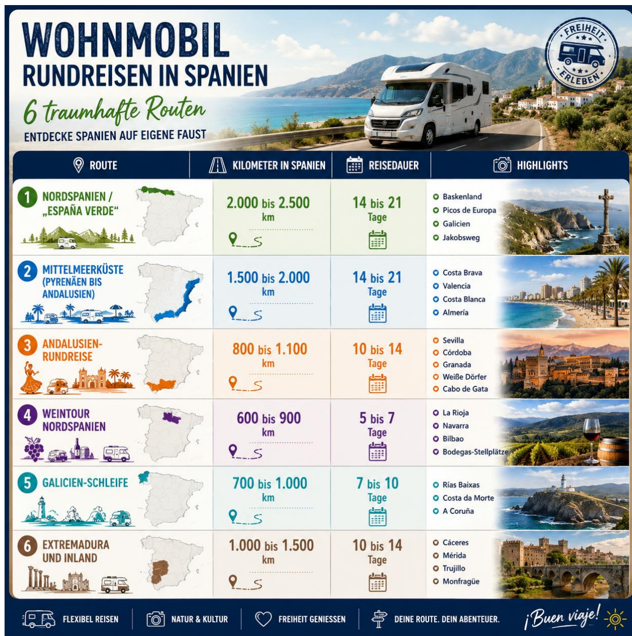
Graphik 1: Übersicht „Typische Entfernungen“

Innerhalb Spaniens haben sich einige Klassiker etabliert, die deutsche Wohnmobil-Magazine wie Promobil und Reisemobil International seit Jahren empfehlen. Die folgende Übersicht zeigt typische Streckenlängen für Rundreisen ab der jeweils nächsten spanischen Grenze. Wer Routen kombiniert oder Abstecher einbaut, kommt schnell auf höhere Werte.